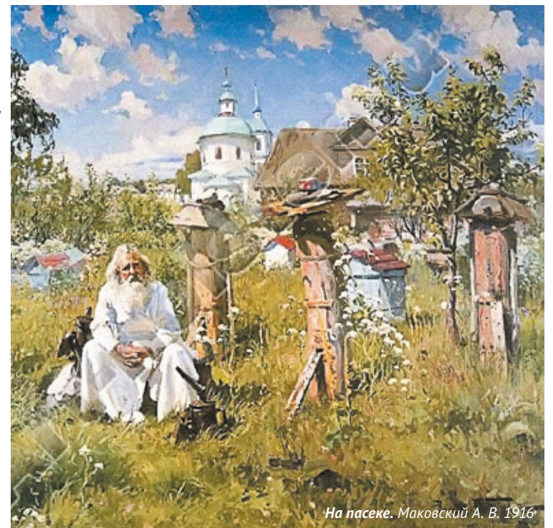
На пасеке. Маковский А. В. 1916

Как только загорелся зеленый, я немедленно выжал