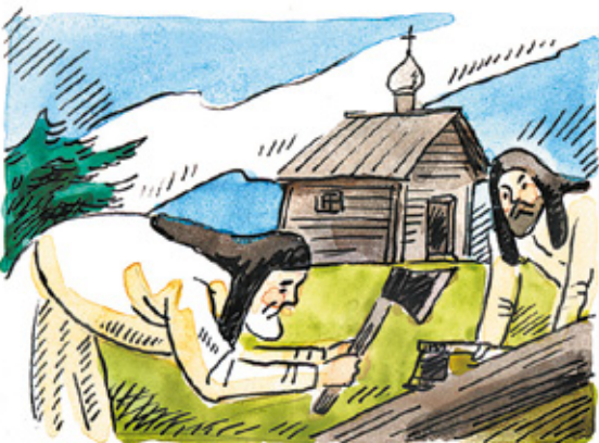
Рисунки Екатерины Гаверилевой

Слава о добродетельных иноках, поселившихся на Соловках, постепенно разошлась по Новгородской земле. Сюда начали прибывать люди, появились новые кельи. Возникла большая монашеская община.