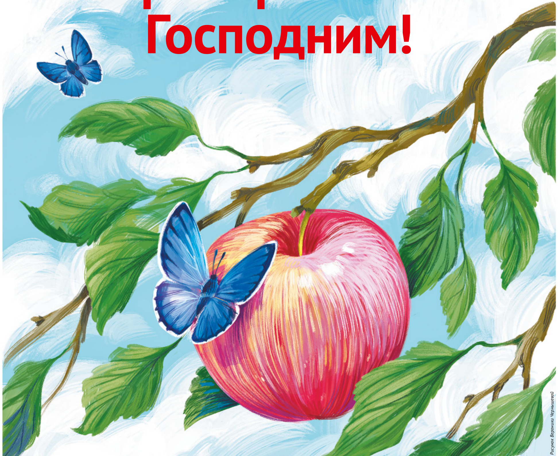
Рисунок Вероники Чернышевой