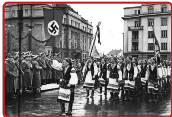
Так было в 1941